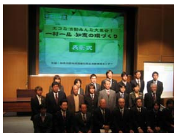
授賞者の方々の集合写真