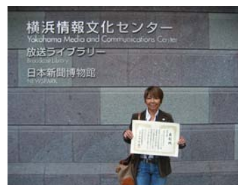
神奈川県海水浴場組合連合会 会長と授賞会場にて