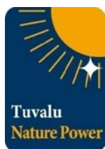
ツバルの森のグリーン電力証書 「ツバルネイチャーパワー」

太陽光や風力などのCO2を排出しない自然エネルギーで発電されたグリーン電力は、電力そのものの価値に加えて、CO2を排出しなかった環境価値を併せ持っています。環境価値の部分を切り離し、証書として取引できるようにしたものがグリーン電力証書です。団体や企業は電力会社から購入する電力に加え、グリーン電力証書を組み合わせることで、消費電力が環境にやさしいグリーン電力によるものとみなすことができます。そして、グリーン電力証書の対価が自然エネルギーの発電事業者へ還元されることで、日本国内における自然エネルギーの普及促進、CO2排出削減に貢献することができます。